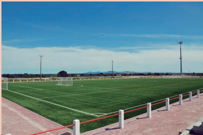
Requalificação e Ampliação das Entradas e Acessos Complementares ao Loteamento Industrial de Nisa – Pavimento Sintético Valor: 176.970,00€