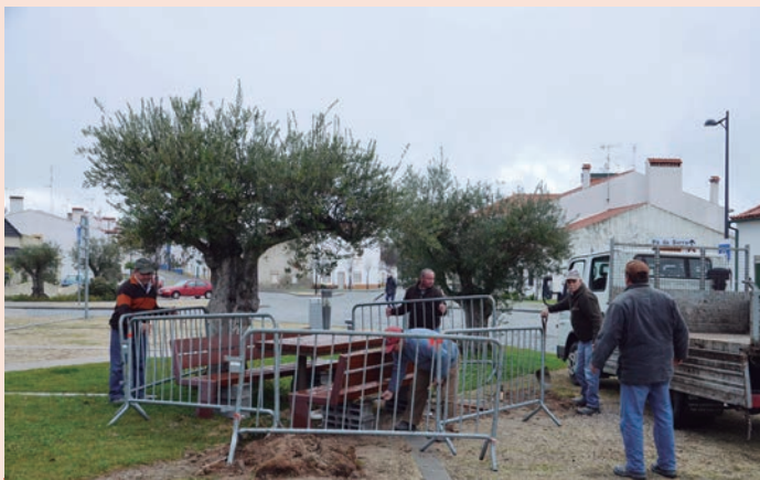
Nisa - Colocação de bancos e mesa na Devesa