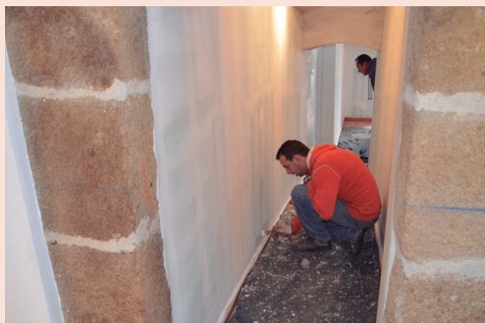
Alpalhão - Recuperação do R/C do edifício da Junta de Freguesia