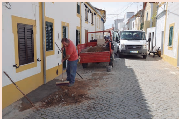
Montalvão - Reposição de calçada