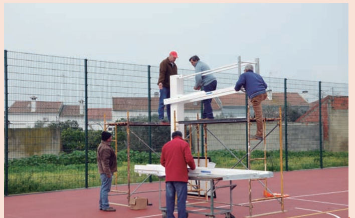
Nisa - Montagem de material desportivo no Centro Escolar