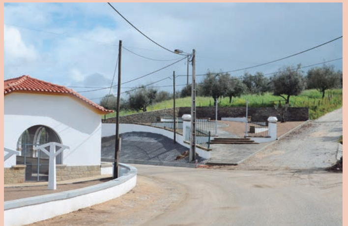
Arranjo Paisagístico e Valorização do Alto de Santa Luzia em Nisa - Ajuste Direto Valor: 28.900,00 € Trabalhos Complementares: 6.825,00 €