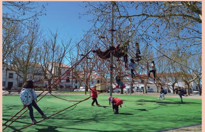
Execução de pavimentos nos parques infantis da Praça da República em Nisa – Ajuste Direto Valor: 40.560,10€