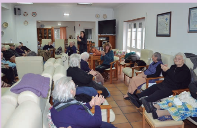
Leituras e Memórias