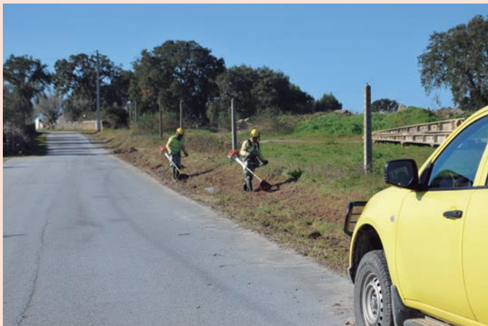
Alpalhão - Limpeza de bermas Estrada N a Sr a Redonda