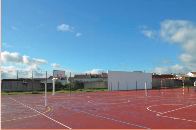
Execução dos Arranjos Exteriores do Centro Escolar Valor: 858.899,76€