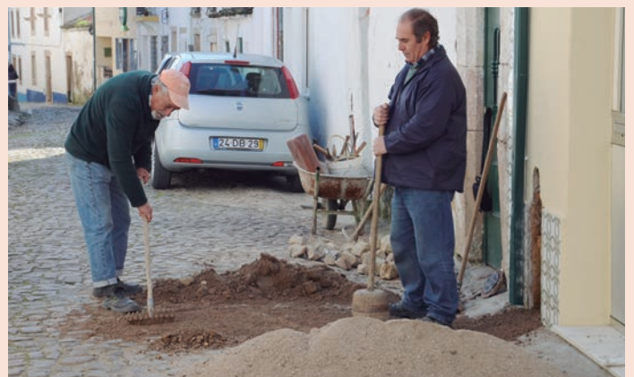
Tolosa - Reposição de calçada