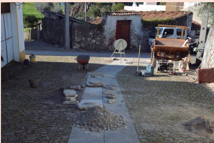
Amieira do Tejo - Reposição de Lajetas