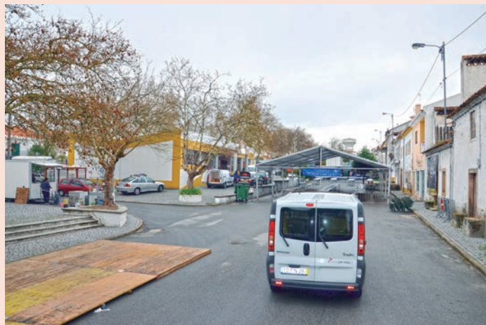
Alpalhão - Montagem/desmontagem da Feira dos Enchidos