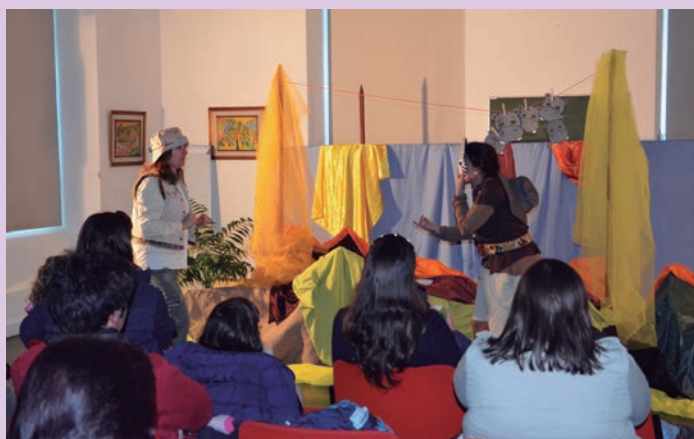
Sábados com Histórias

A iniciativa “Leituras e Memórias” levou aos Centros de Dia e Lares do concelho as possibilidade de relembrar os temas da “Emigração” e “Ser Mulher”. Também a iniciativa “Chá com Letras” reuniu na Biblioteca muitas senhoras que em tertúlia abordaram o tema do “Amor”.