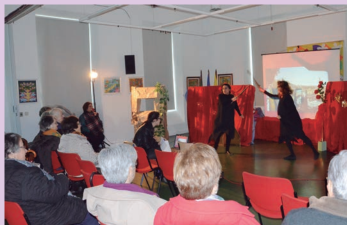
Chá com Letras