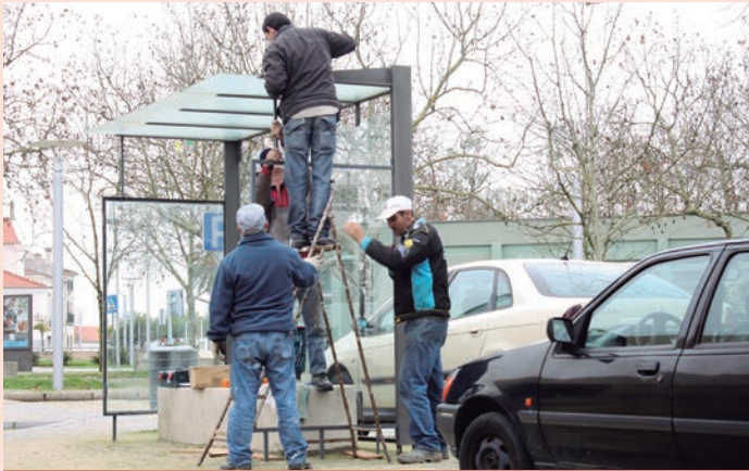
Nisa - Colocação de vidro na paragem dos autocarros