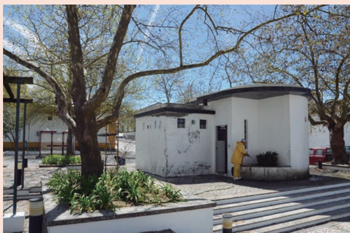
Alpalhão - Pinturas no Jardim e Largo da Devesa de baixo