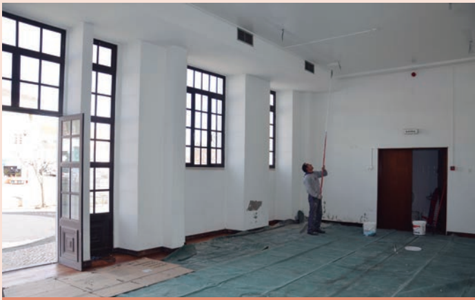
Nisa - Recuperação de sala no Cine-Teatro