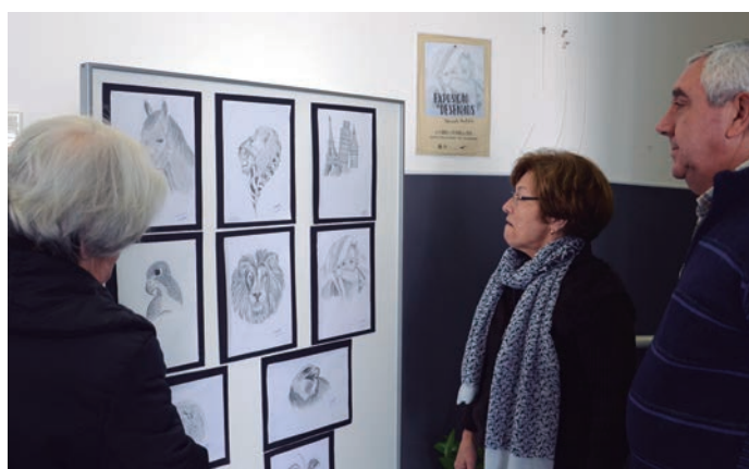
“Exposição de desenhos” de Micaela Fontelas