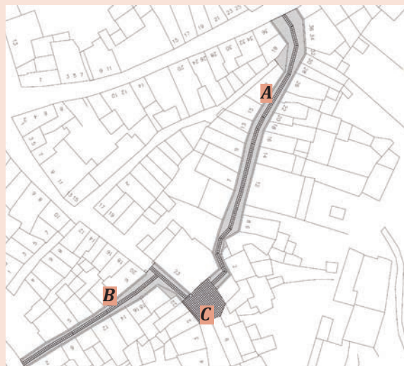
A - Rua de Palhais ; B - Rua do Engenho; C - Largo do Terreiro

A realização deste projeto, pretende requalificar a Rua do Engenho, Rua de Palhais e Largo do Terreiro, em Amieira do Tejo com o objetivo de regularizar e homogeneizar pavimentos, uma vez que estes se encontram em muito mau estado de conservação e com diferentes tipos de acabamento.