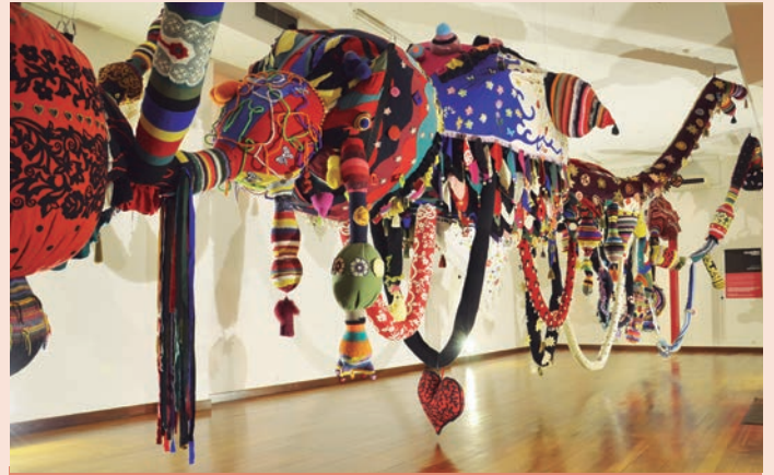
Nisa - Instalação da Valquíria Enxoval - Visitas gratuitas