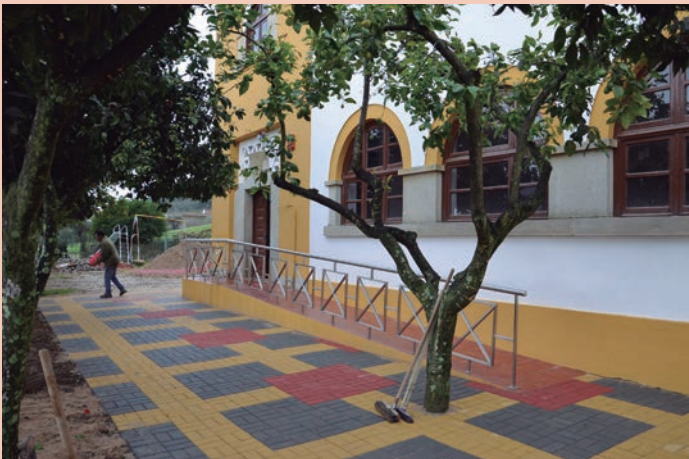
Centro Interpretativo do Conhal - Monte do Duque Valor: 131,093,47€