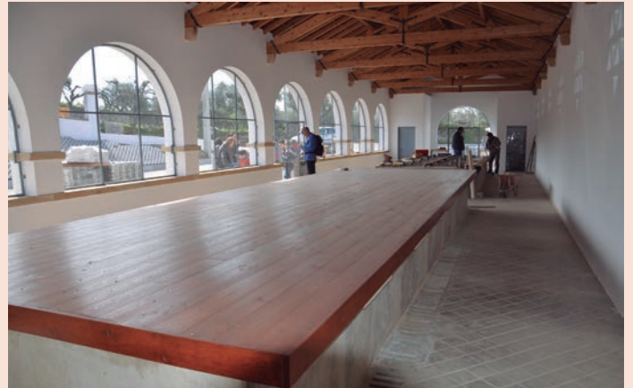
Nisa - Requalificação dos Lavadouros da Fonte Frade