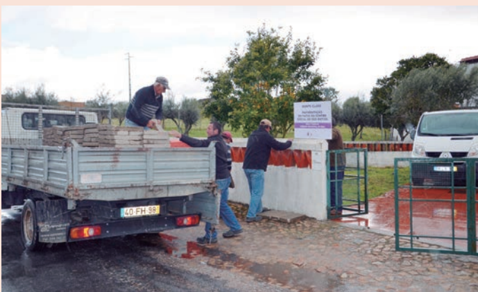
São Matias - Pavimentação do Pátio do Centro Social