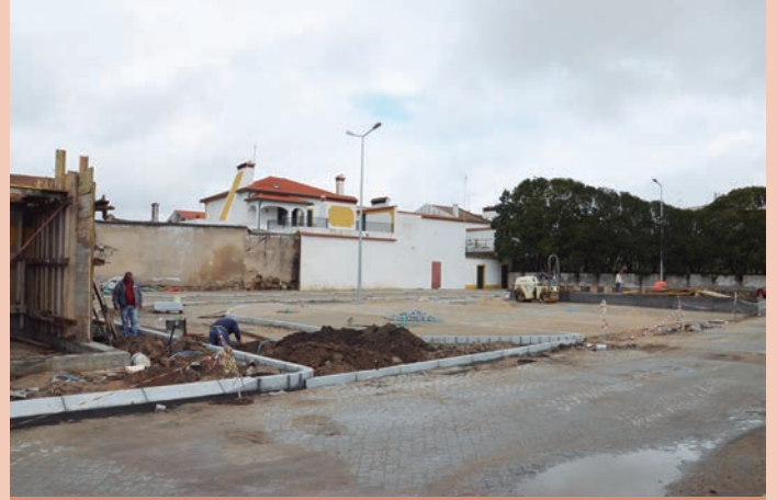
Requalificação do Mercado Municipal e Áreas Envoltentes Valor: 468.999,99€