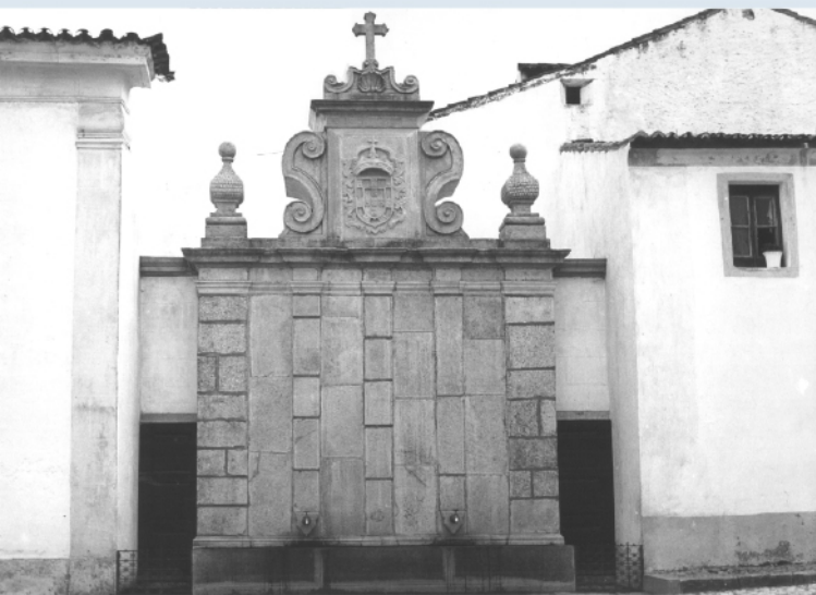
Fonte do Frade - Praça do Município

É uma alternativa ao PR10 NIS ROTEIRO DAS FONTES , com uma sinalética própria e independente do percurso pedestre balizado, serve para todos os que desejem conhecê-lo na sua vertente urbana.