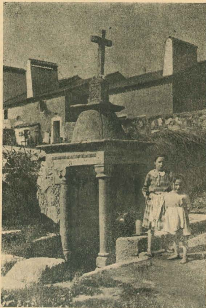
A FONTE DA PIPA, hoje, como ha vinte anos, inteiramente entregue ao abandono, dando a impressão, aliás falsa, de que as coisas de arte não preocupam as gentes da Vila.

Quando o carpinteiro tem madeira que lavar e a mulher pão para amassar, não lhe falta pão que comer e lenha que queimar.