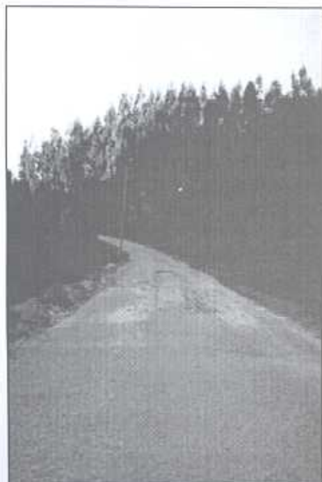
A recuperação da estrada da Vinagra é uma das prioridades da Junta

O Plano da Actividades da Freguesia de S. Simão contempla ainda obras a realizar na localidade de Vinagra. Neste capítulo solicita-se apoio no sentido de dotar a