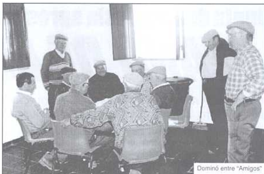
Dominó entre "Amigos"

Desde a entrada em vigor do presente mandato realizaram as Festas em honra de S. Simão, a matança do porco, uma