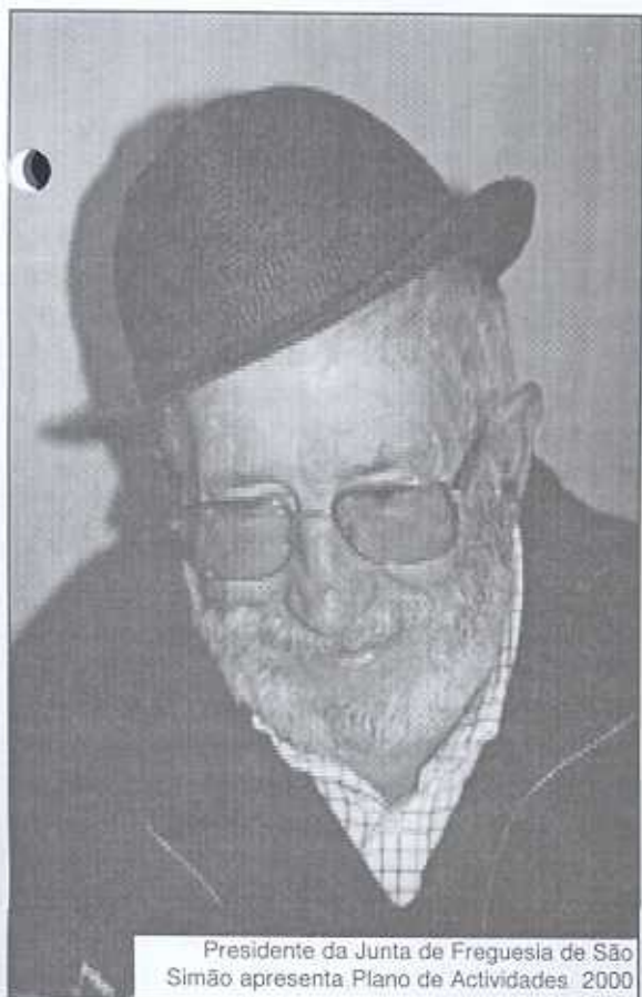
Presidente da Junta de Freguesia de São Simão apresenta Plano de Actividades 2000

propício à ocorrência de acidentes, principalmente quando dois veículos se cruzam. A intervenção projectada incide precisamente sobre a "parte de fora" da estrada. Pretende-se evitar o êxodo dos pequenos fragmentos de asfalto segurando-os com uma fila de calçada em torno da estrada.