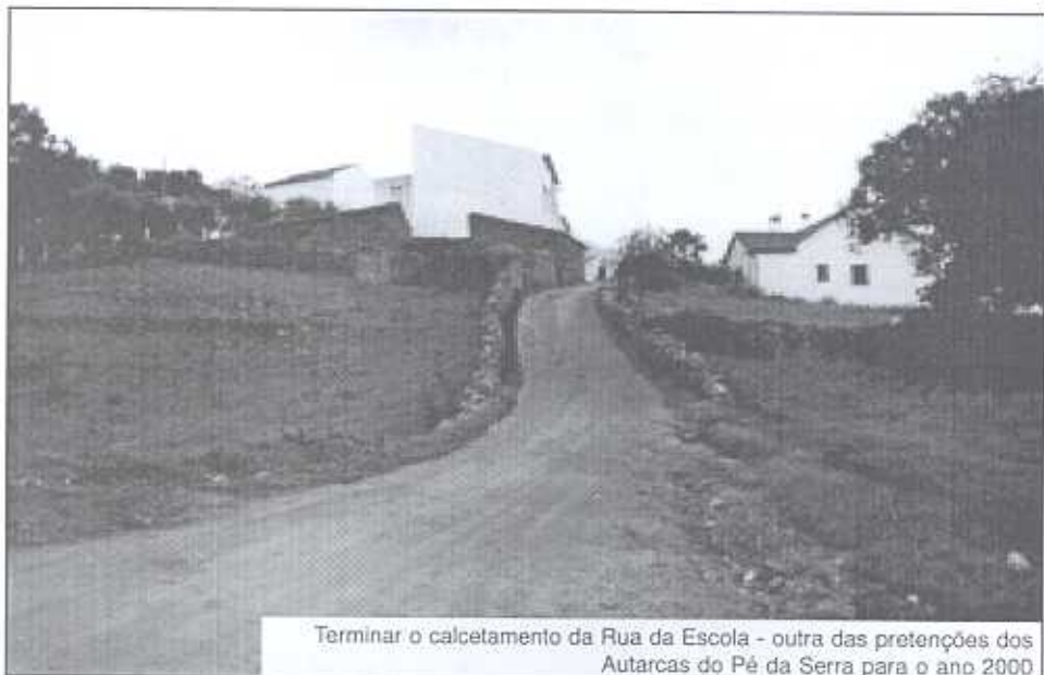
Terminar o calcetamento da Rua da Escola - outra das pretensões dos Autarcas do Pé da Serra para o ano 2000

A Estrada Municipal 522 tem vindo a deteriorar-se a considerável velocidade. É bastante notório o seu estado de degradação, nomeadamente junto às bermas, onde o asfalto já há muito saltou. Tornando assim a estrada um local