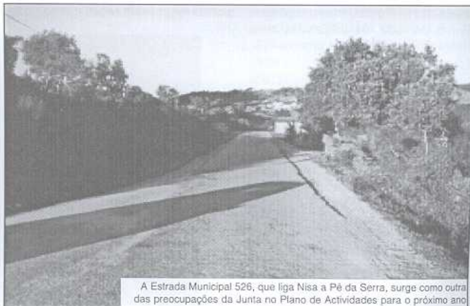
A Estrada Municipal 526, que liga Nisa a Pé da Serra, surge como outra das preocupações da Junta no Plano de Actividades para o próximo ano

A Saúde também se encontra contemplada e, neste item, a Junta de Freguesia propõe a realização de contactos conducentes à melhoria dos serviços de Saúde, pretende-se a resolução do problema da assistência médica durante o período de férias do Médico que assiste a Freguesia. Propõe-