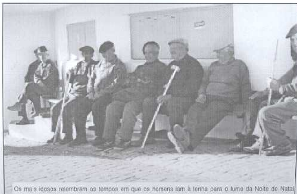
Os mais idosos relembra os tempos em que os homens iam à lenha para o lume da Noite de Natal

Os homens juntavam-se e, tomando "emprestada" uma das carretas estacionadas na rua, iam buscar lenha. Responsabilizando-se ainda pela