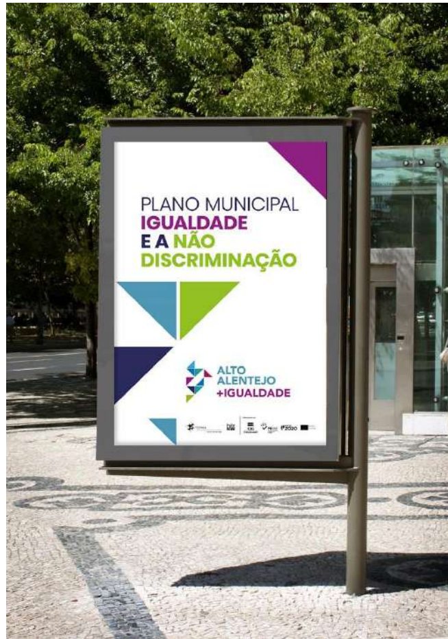
Figura 1 – Mupi de divulgação do PMIND