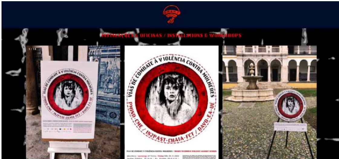
Figura 8 – Partilha de experiências da Câmara Municipal de Évora