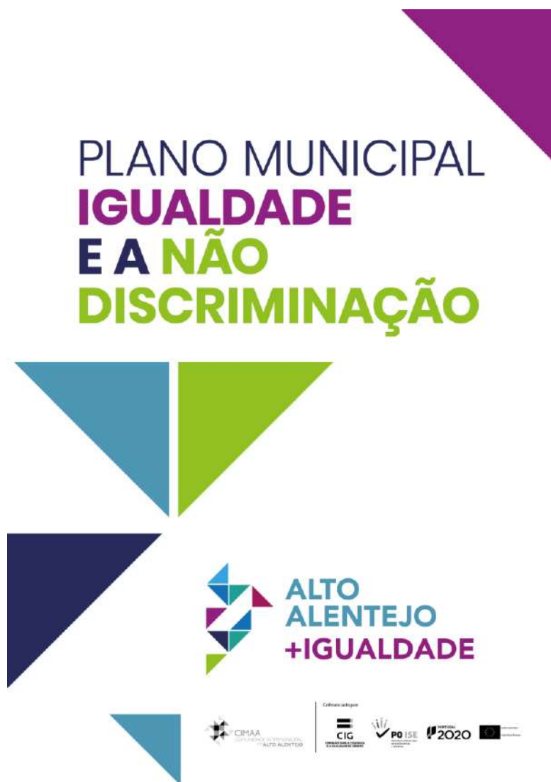
Figura 4 – Poster de divulgação do PMIND