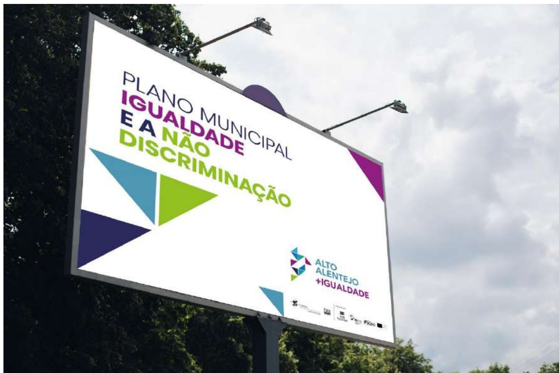
Figura 2 – Outdoor de divulgação do PMIND