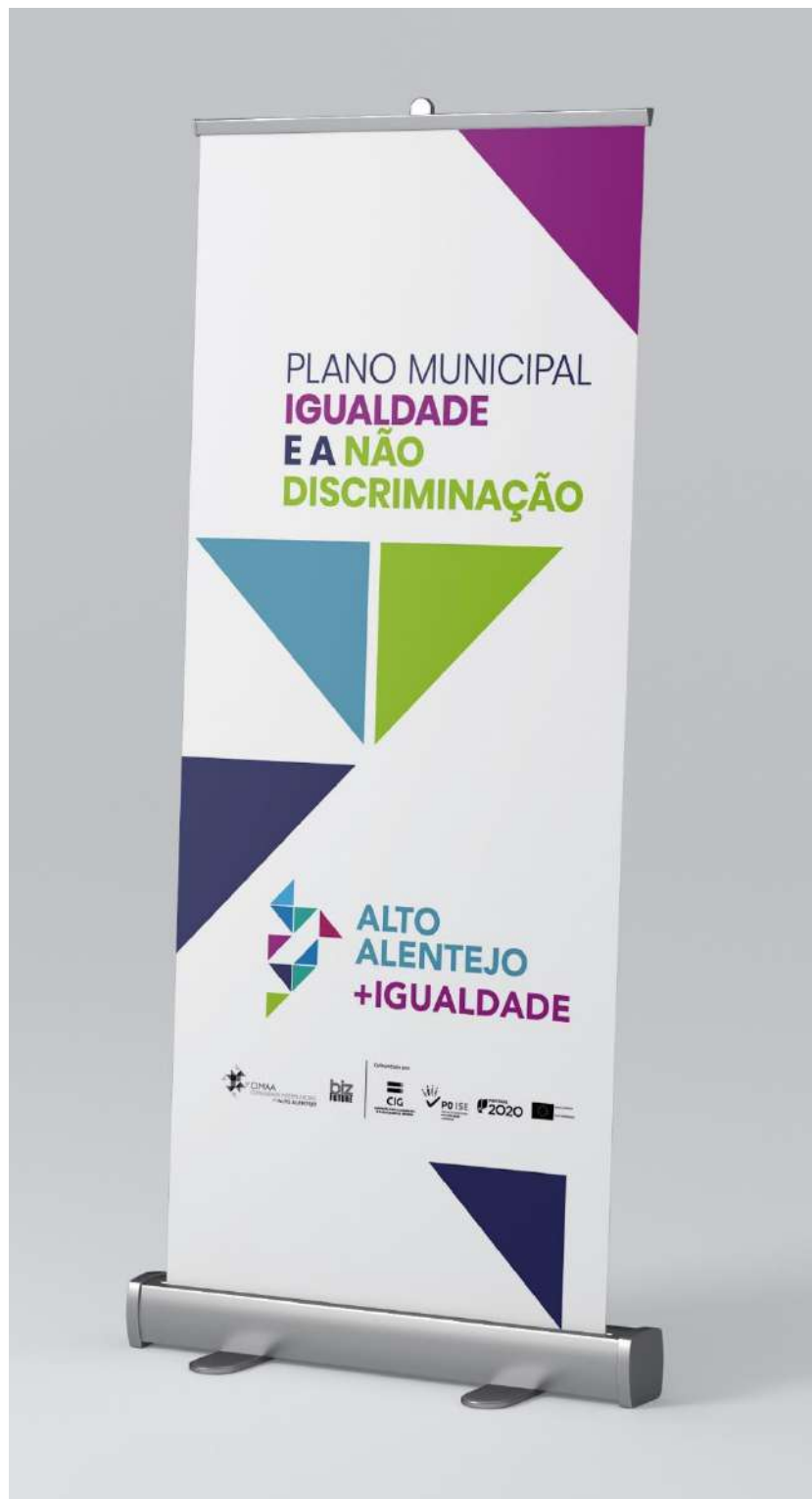
Figura 5 – Roll up de divulgação do PMIND