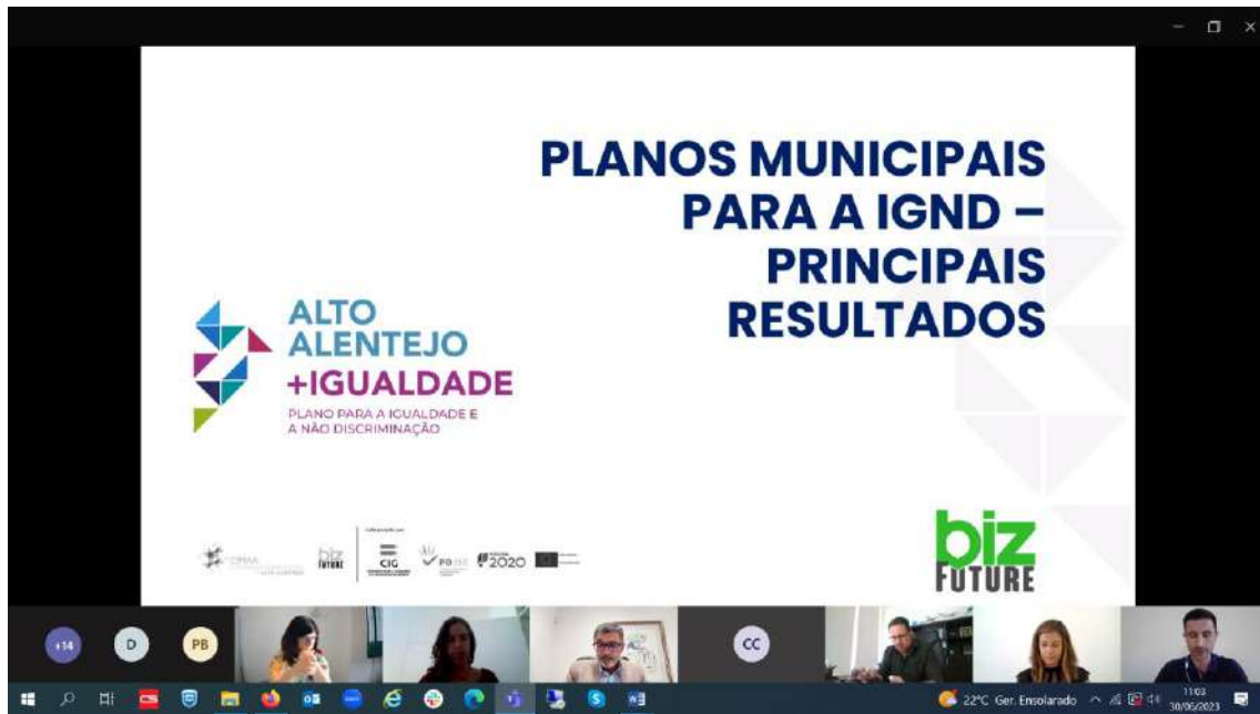
Figura 6 - Evidências do Seminário Alto Alentejo + Igualdade