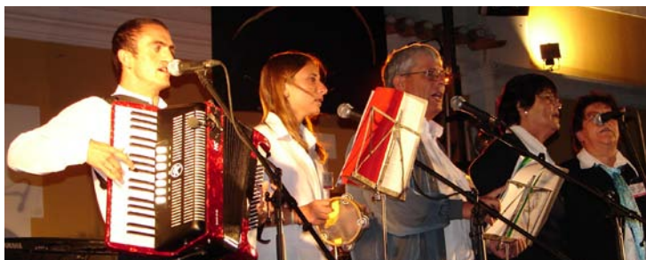
Grupo Coral d'Os Leões

A iniciativa está a ter sucesso e o mês de Setembro promete com Fado e Bandas Filarmónicas.