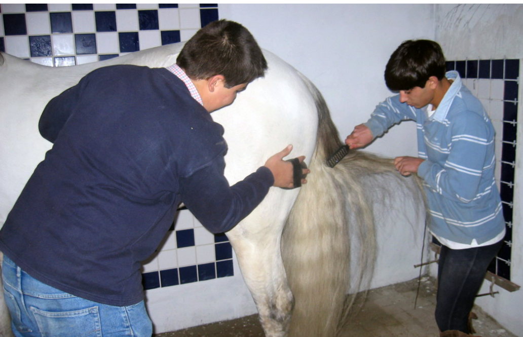
Dois jovens educandos da Coudelaria Ribeirinho Paralta em práticas equinas: escovar a rabada e limpar com a almafoça.

Na coudelaria Ribeirinho Paralta, as lições têm sumário inscrito nos gestos e gravado nas atitudes. Afinal...uma Escola não é o Lugar para fazer crescer bem e em todos os sentidos?!