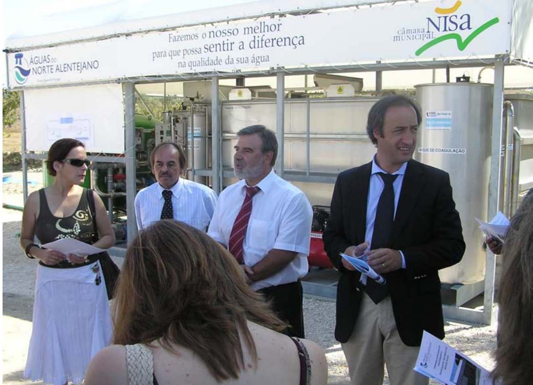
Inauguração da ETA de Tolosa com a Presidente da Câmara ladeada pelos responsáveis das Águas do Norte Alentejano