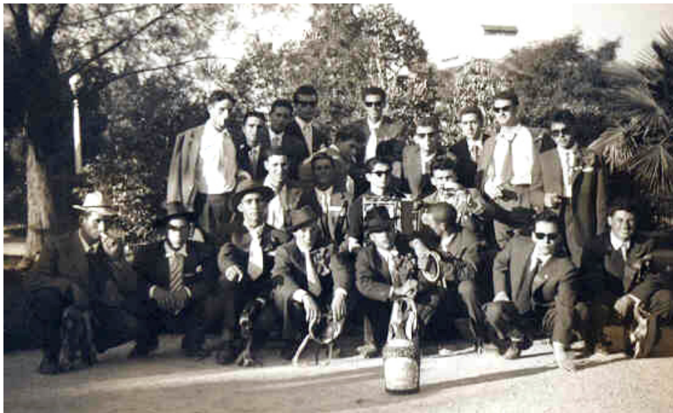
Mancebos de Nisa, finais dos anos 50, no dia da Inspeção Militar

Rostos do conelho que irão ao Dia de Defesa Nacional que visa sensibilizar os jovens para a temática da Defesa Nacional e divulgar o papel das Forças Armadas.