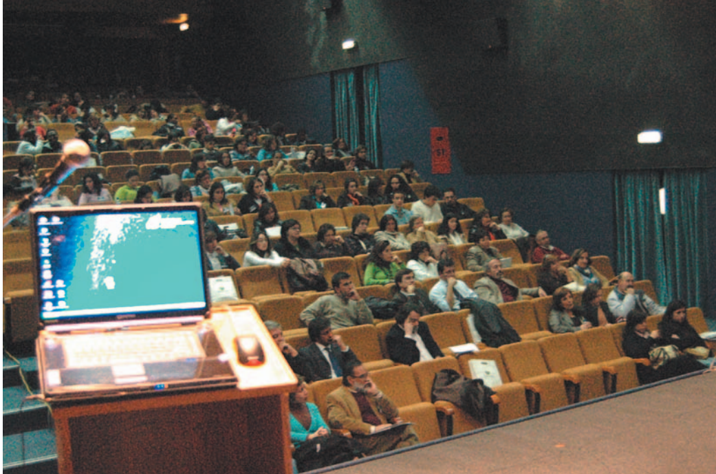
Promenor da assistência no I Encontro de Termalismo de Nisa realizado em Novembro de 2005

Continuando fiel aos seus princípios gerais de parceria do espaço comunicacional das diversas áreas da actividade termal, não repete temas anteriores, tendo este ano como principais painéis: “Lamas: a sua aplicação nos dias de hoje”, “Estética e Cosmética Termals” e “Turismo Termal”.