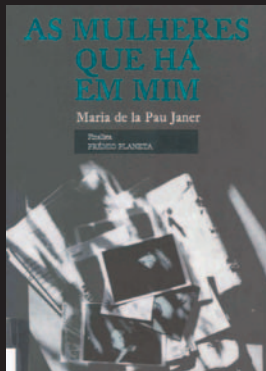
Título: As mulheres que há em mim Autor: JANER, Maria de la Pau

Protagonistas e leitor são apanhados num vórtice de genialidade, loucura, traição e assassinio, do qual os primeiros tentam escapar com vida e o segundo se descobre cativo, dominado por um magnetismo somente comparável ao daquela obra.