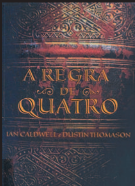
Título: A regra de quatro Autor: CALDWELL, Ian; THOMASON, Dustin

É uma prodigiosa estreia literária, um thriller de grande suspense intelectual, construído em torno dessa obra enigmática do Renascimento (Hypnerotomachia).