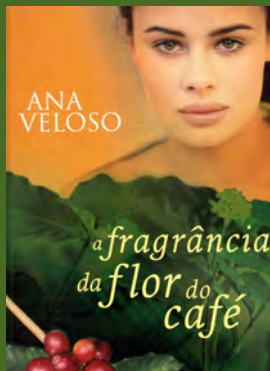
Título: A Fragrância do Café Autor: VELOSO, Ana

Vitória ambiciona mais, muito mais. Vita, como lhe chamam, é filha de um dos mais ricos «barões do café». Possui uma beleza extraordinária, é inteligente, habilidosa nos negócios, com uma personalidade forte e independente, é já considerada o melhor partido do vale.