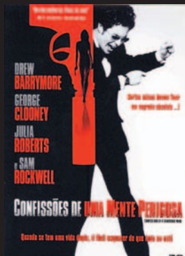
Título: Confissões de uma Mente Perigosa Gênero: Thriller