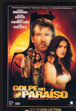
Título: Golpe no Paraíso Gênero: Thriller