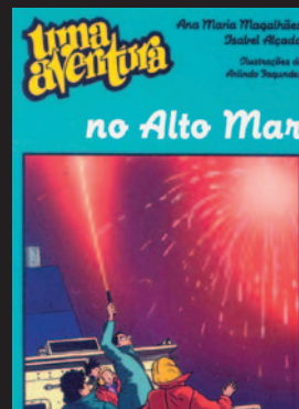
Título: Uma Aventura no Alto Mar Autor: MAGALHÃES, Ana Maria, ALÇADA, Isabel

A decifração do diário leva-o para um mundo de conspirações seiscentistas e ainda mais para trás, para as sanguinárias Cruzadas e a localização de uma relíquia sagrada. (...)