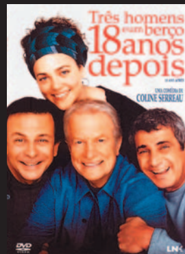
Título: Três Homens e um berço 18 anos depois Gênero: Comédia