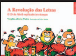
Título: A Revolução das Letras Autor: VIEIRA, Vergílio Alberto

Quem primeiro deu o alerta no Quartel das Letras foi o Cabo Clarim que, farto de tocar a recolher, ou porque não, ou porque sim, anunciou de pronto a hora do motim.