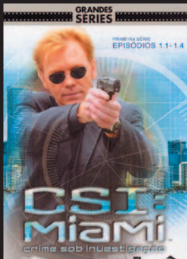
Título: CSI Miami Gênero: Policial