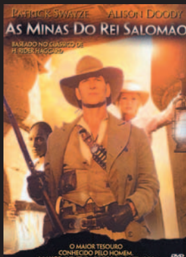
Título: As minas do Rei Salomão Gênero: Aventura