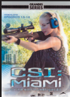
Título: CSI Miami Gênero: Policial