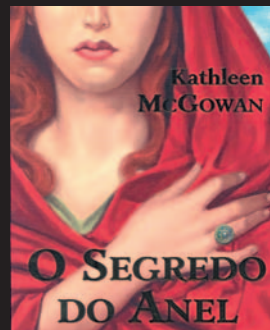
Título: O Segredo do Anel Autor: MCGOWAN, Kathleen

A recordação que mais a assombra é a do dia em que a árvore do quintal foi cortada, era ainda criança, de como foi brutalmente dilacerada, como as suas raízes teimando não deixar a terra, foram arrancadas como se de um troféu se tratassem. Anos decorridos, numa alma em que habita ressentimento, em que a dor é uma condição para se sentir viva, tudo se despedaçou na vida da protagonista como a árvore cortada da sua infância, e é por sentir que também algo lhe falta, lhe foi truncado, que ela decide partir por um caminho de perguntas, em busca de si própria através dos trilhos sinuosos da história da sua família, aquela que também é a sua história.