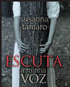
Título: Escuta a minha voz Autor: TAMARO, Susanna